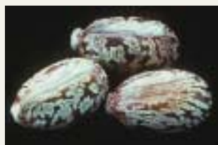
Figur 1. Ricinus communis – kristpalme, amerikansk olieplante (engelsk: Castor bean), medlem af vortemælkfamilien ( Euphorbiaceae ). Planten stammer oprindeligt fra tropisk Afrika, men er i dag udbredt over en stor del af kloden, bl.a. fordi det er en smuk haveplante. Kristpalme kan blive op til 13 meter i troperne, men bliver mindre og mere urteagtig, jo koldere klimaet er. I tempererede egne overlever den kun som en etårig urt i sommerperioden. Bladene er store, grønne til røde, håndsnittede. Blomsterne sidder i klaser, og frugten er en valnøddestor kapsel, der slynger sine tre frø ud, når de er modne. Frøene er ovale, grå til brunlige og smukt marmorerede. Planten vokser meget hurtigt – så hurtigt, at den af mange kristne opfattes som profeten Jonas' redning, da den på én nat voksede op, og med sine store blade kunne beskytte mod den brændende ørkensol (Jonas Bog, 4. Kap, v. 6-10). Plantens frø bruges bl.a. til fremstilling af halskæder eller til udvinding af amerikansk olie. (Træsnittet af kristpalmen er fra år 1550 (Nielsen 1980).).

Perforationerne tillod indholdet at lække ud i Markovs krop. Heldigvis var der stadig rester af giften i kapslen, for ellers ville dødsårsagen have været meget svær at fastslå. Analysen af resterne viste, at der var tale om giftstoffet ricin, der stammer fra planten Ricinus communis , kristpalme (figur 1). Risikoen