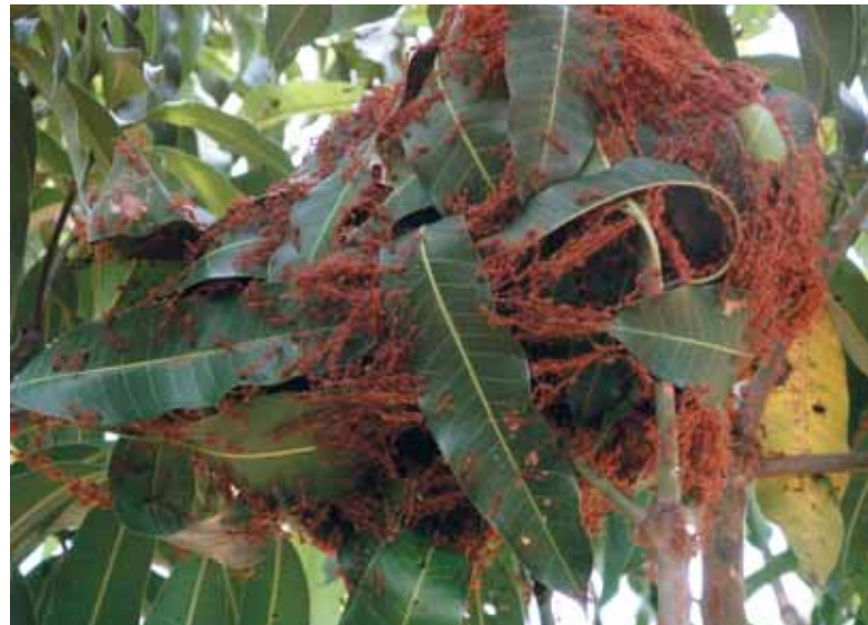
En vævermyrekoloni i færd med at bygge en bladrede i en thailandsk mangoplantage. De rødbrune myrer danner lange kæder, når de skal trække bladene sammen. Senere væves blade sammen med silke produceret af myrerlarverne. Ikke alle planter har lige velegnede blade, specielt når myrerne grænsen for deres formåen i visse typer af palmeblade.