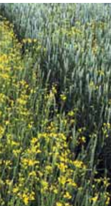
Figur 2. Vårhvede sået på tre måder, hvor raps (gule blomster) er sået som »ukrudt« (200 pr. m 2 ). Til venstre: Vårhvede sået i lav tæthed (200 pr. m 2 ). I midten: Vårhvede sået i høj tæthed (600 pr. m 2 ) i normale rækker. Til højre: Vårhvede sået i høj tæthed (600 pr. m 2 ) i et uniformt mønster

I et treårigt projekt bevilget af Statens Jordbrugs- og Veterinærvidenskabelige Forskningsråd, har vi ►