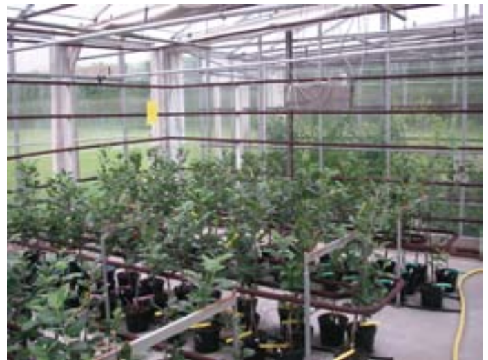
Figur 3. De podede æbleplanter i drivhuset i Årsløv.

Projekterne er en del af et stort EU-projekt, kaldet ISAFRUIT, som fokuserer på alle aspekter af frugt fra dens start som frø