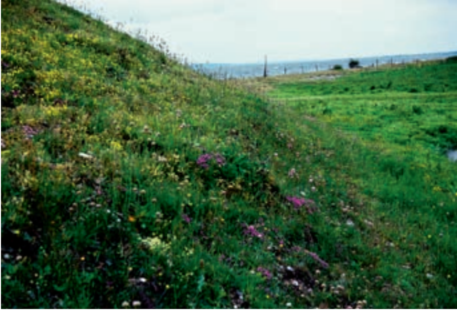
Figur 4-4. Kystnær, frodig skrænt, hvor der har været græsset i mange år. Der ses bl.a. engelskgræs og storstenæb.

vore dagsommerfugle så sjældne, at en række arter går tilbage, nogle er endog forsvundet eller er truede.