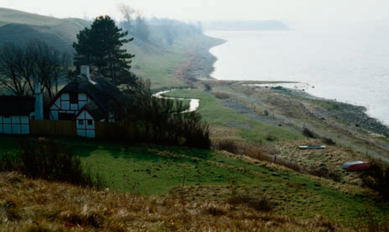
Figur 4-1. Drømmen om igen at få plads til natur i landbruget.

men samtidig blev der plads til et betydeligt naturelement i selve landbruget. Eksempelvis blev der som hovedregel en mere artsrig flora i agerlandet, og på insektsiden fulgte bl.a. dagsommerfugle med, mens agerhøne og hare blandt de lidt større dyr havde glæde af agerlandet.