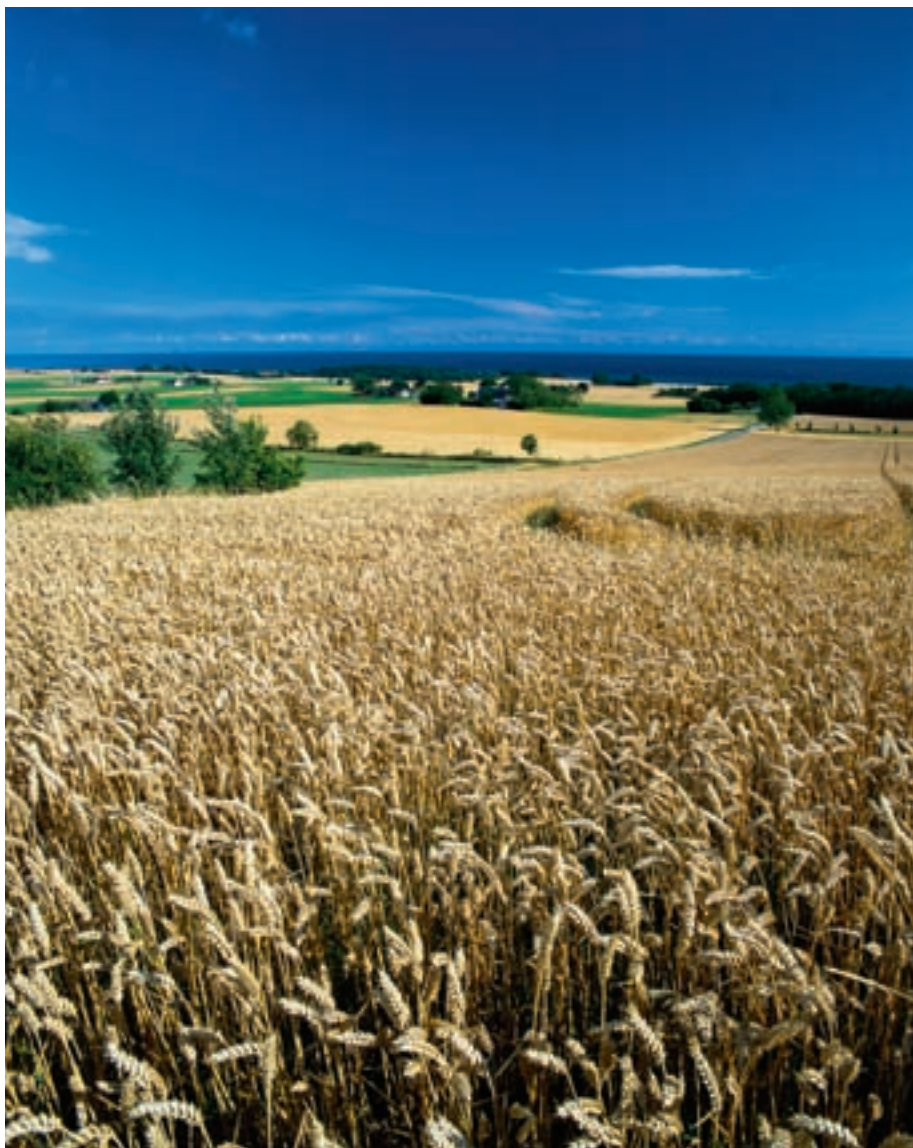
Figur 4-5. Bliver der mon plads til naturen?

fx det ovennævnte kinesiske marked for svinekød kan blive særdeles lukrativt, især da man fra dén side næppe vil blande sig i danske miljøproblemer og etiske overvejelser vedr. mere eller mindre krølle på grisehaler.