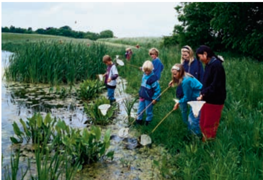
Figur 4-6. Den voksende befolkning har behov for udfoldelse i naturen. Nogle udfoldelser er skånsomme, men andre slider hårdt på naturen.

gerne i højere grad vil komme til at se sig som en del af et dansk fællesskab frem for en "vi-vil-selv-enklave" er der basis for, at samfundet betaler sig til adgang til, og forvaltning af, væsentlige natur-elementer i form af delarealer, som mere plejes end dyrkes.