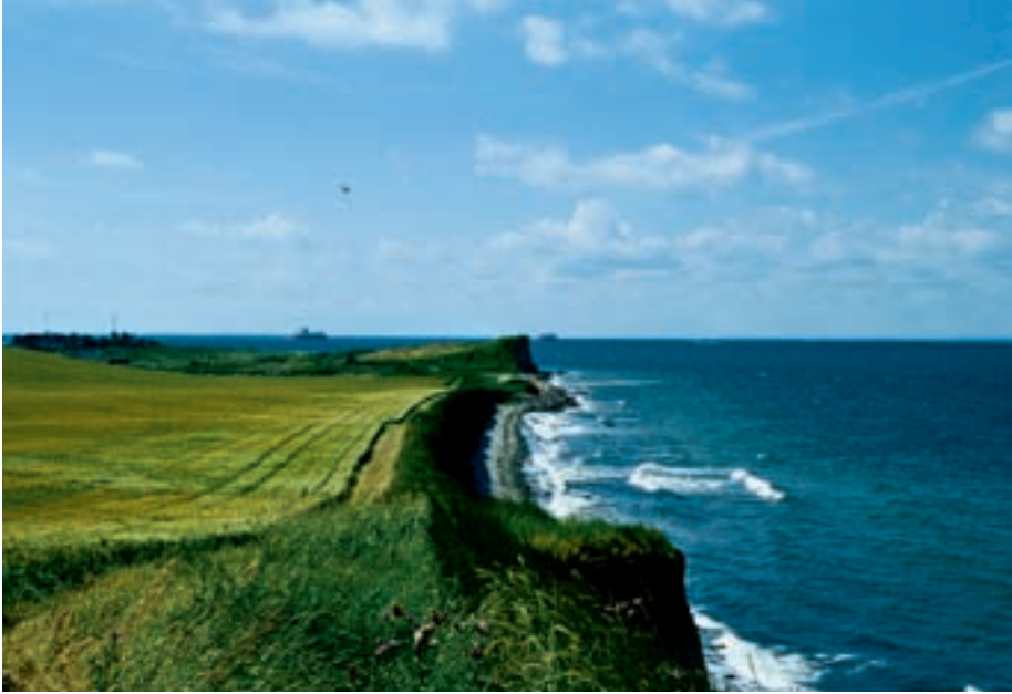
Figur 4-7. Ofte går landbruget tæt på den urørte natur.

uden brug af tvang. Hvis de nuværende tendenser til øget udbud af økologiske varer og dannelse af varemærker, der som et minimum garanterer pesticidfrihed, vokser, kan man forudse en opsplitning af verdens fødevarerprodukter i to hovedkategorier. Den ene og globalt dominerende et langt stykke tid vil være den hjælpestofbaserede og billige, som bl.a. vil dække stort set hele den tredje verden. Den anden meget mindre, men prismæssigt langt mere interessante vil være den helt eller næsten hjælpestoffrie og økologisk/naturbeskyttelsesmæssigt set mere eller mindre rigtige produktion. Den vil have sit marked blandt de økonomisk bedst stillede og til dels de mest uddannede befolkningslementer – primært i Vesten og til dels i det østasiatiske område.