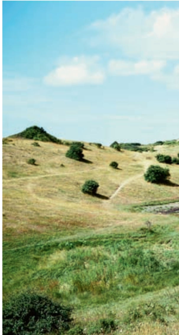
Figur 4-8. En uopdyrket bakkekam kan virke som faunakorridor, hvor dyrene kan passere fra det ene levested til det andet og på den måde opretholde sunde bestande.

Yderligere vil der i betydeligt omfang være den effekt, at dyrkning af mere marginale områder vil blive droppet,