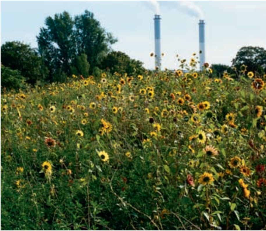
Figur 3-6. Paradisets have er i fremtiden fyldt med problemer og konflikter.