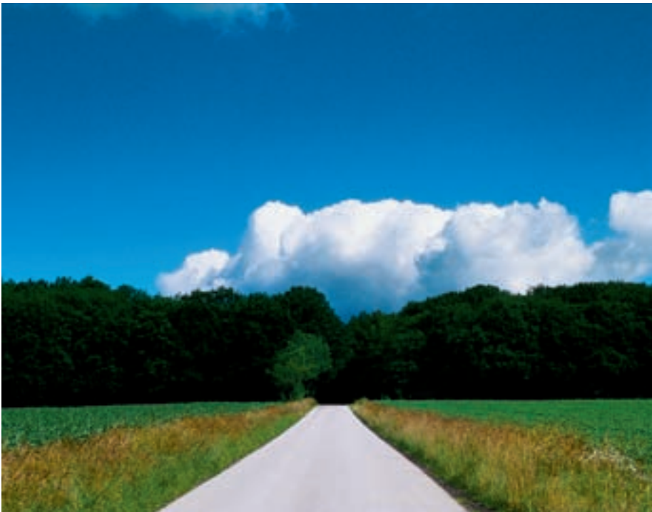
Figur 3-3. Det landskab, som huser jordbruget, kan ses som noget bygget.

netop, som vi mener den uforarbejdede natur gør, som de fritvoksende, selvgroede, naturligt selekterede, hjemmehørende planter, ikke tilfældigt, men efter en ganske bestemt plan, der ligger uden for den menneskelige rækkevidde. Udtryk som naturlig opførsel, naturlig kost og naturligt hjemmehørende planter er angiveligt beskrivende, men i virkeligheden vurderende. Det forarbejdede, det dyrkede, det kunstige, kunsten, kulturen bliver således det modsatte af den naturlige natur. Kunst bliver unatur. Det kan imidlertid anses for at være lige så naturligt at overvinde sin natur, hvis det er den handling, der gør et menneske til menneske.