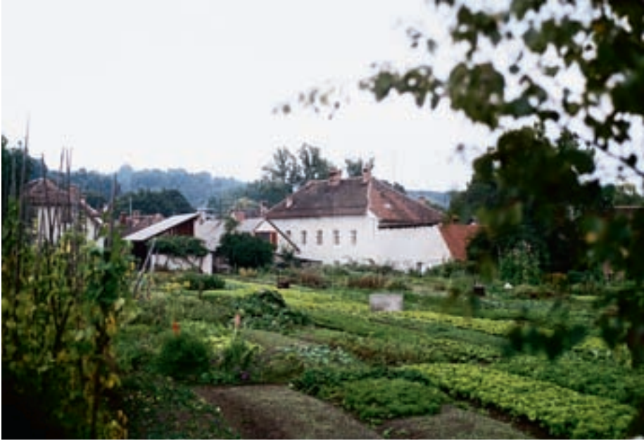
Figur 3-8. Haven som gård. Gartneriets æstetik.

livet har erstattet kærligheden til livet. Den er et jordbrugslandskab, hvor det kan ses, at mennesker har forsonet sig med hinanden og naturen, et landskab, der er så gæstfrit, at man kan plukke ærter på vej til skole, et æble på vej hjem fra arbejde og en buket blomster på søndagsturen. Lars Von Trier betragter det som et urinstinkt og dermed en menneskeret at kunne nedlægge vildt og fiske. Med tanke for disse kvindelige henholdsvis mandlige urinstikter burde vi tilbydes et jordbrugslandskab, der symbolsk og reelt tilkendegiver, at god, selvplukket og selvfangeret føde er essentielt.