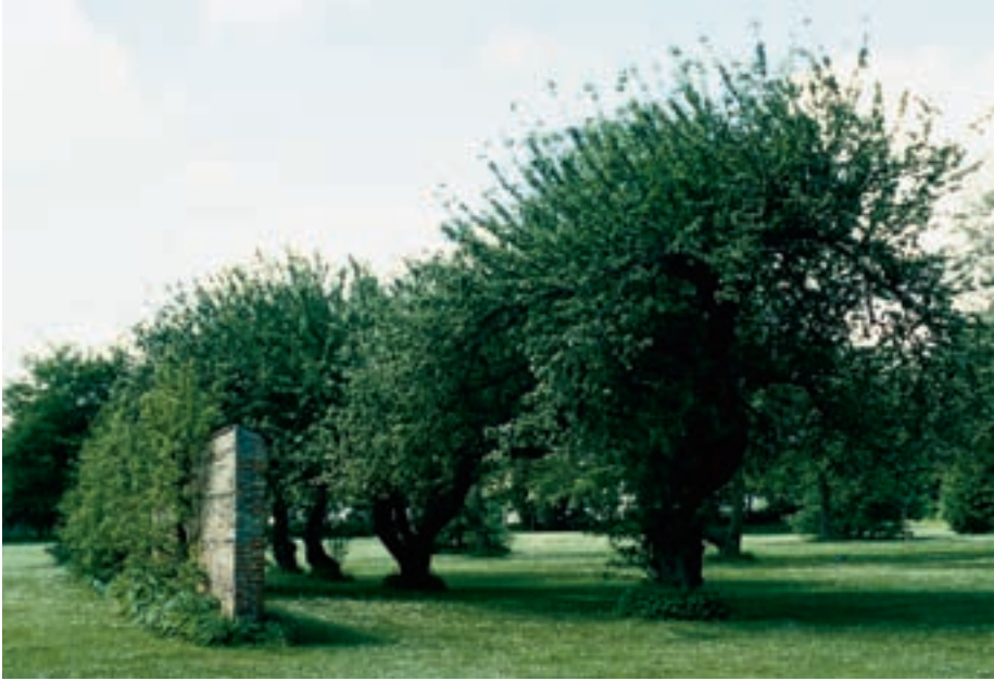
Figur 3-7. Gartneriets æstetik. Frugtplantager og orangegårde.

uden jordbruget. Bag jordbrugslandskabs eventuelle omdannelse til spisekammer og køkkenhave fra at have været levægelse og fabrik må ligge en forståelse for, at dyrkningsprocessen har sin egen æstetik, og at den er foranderlig. Den forståelse kan hentes i kunsten. Landskabs- og havekunsten kan bruges som redskab til at forstå sådanne omdannelser, der bygger på nye idéer og nye tolkninger.