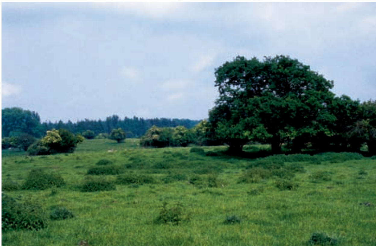
Figur 3-2. Overdrevet – til græsning.

Blændrammen kan gøres større, således at den indhegnede have udvides til det agrikulturelle landskab, og engen til græsning omfatter løvengen til høslæt. Begreberne hortus-pastorale dækker, hvad man kunne kalde gartnerens versus hyrdens æstetik. Når et givet værk indsættes i modellen, tegner der sig billedet af en æstetik, der kan hjælpe en til at se, om betydningen ligger i det ordnede eller det uordnede, i det klare eller det dunkle, i det menneske- eller det naturskabte – ud fra den teori, at læsningen af det æstetiske sprog kan afdække synet på naturen, den ydre som den indre .