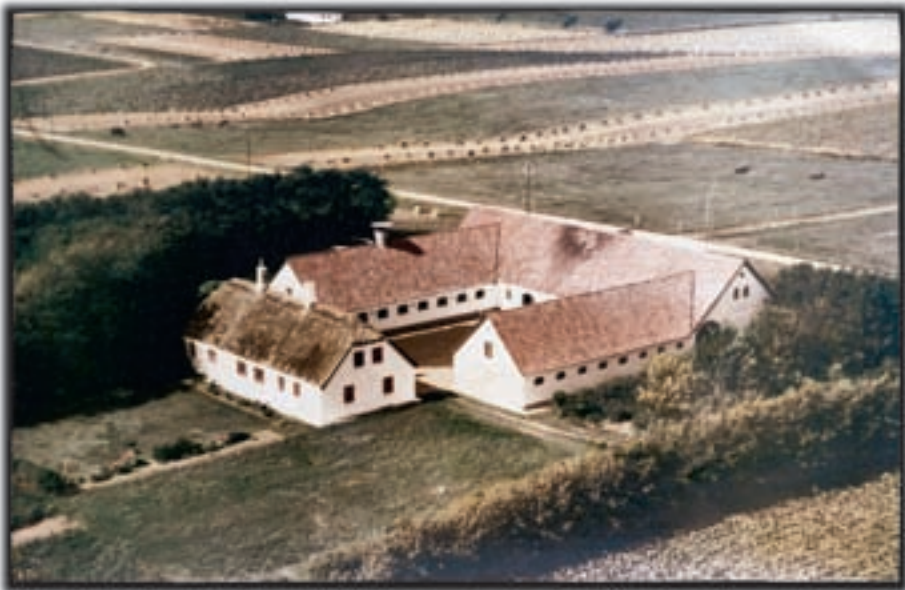
Figur 2-3. Typisk firlænget gård fra omkring 1960. Der er grise, køer og høns og neg på markerne. Bemærk i øvrigt de små marker.

landbyfællesskaber i form af en klump gårde med et gadekær i midten, men hyppigere ser man selvfølgelig gårde spredt ud over markerne. Også de små