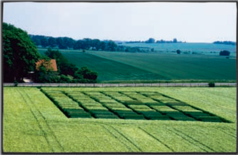
Figur 2-5. Landbrugets stadige tilpasning har bl.a. krævet omfattende forsøgsvirksomhed.

resultat af åndelig vækkelse. Men de ændrede relative priser gjorde det nærliggende at skifte fra kornproduktion til animalsk produktion. Vi viftede heller ikke – modsat de fleste kontinentaleuropæiske lande – med den førømtalte frihandelsfane, fordi vi med åben pande tog udfordringerne op og tilpassede os, men fordi det er meget dyrt at beskytte et erhverv, hvis det er et eksporterhverv. De kontinentaleuropæiske økonomier, der beskyttede landbruget, var typisk importlande, der således modsat os fik toldindtægter i statskasserne ud af beskyttelsen.