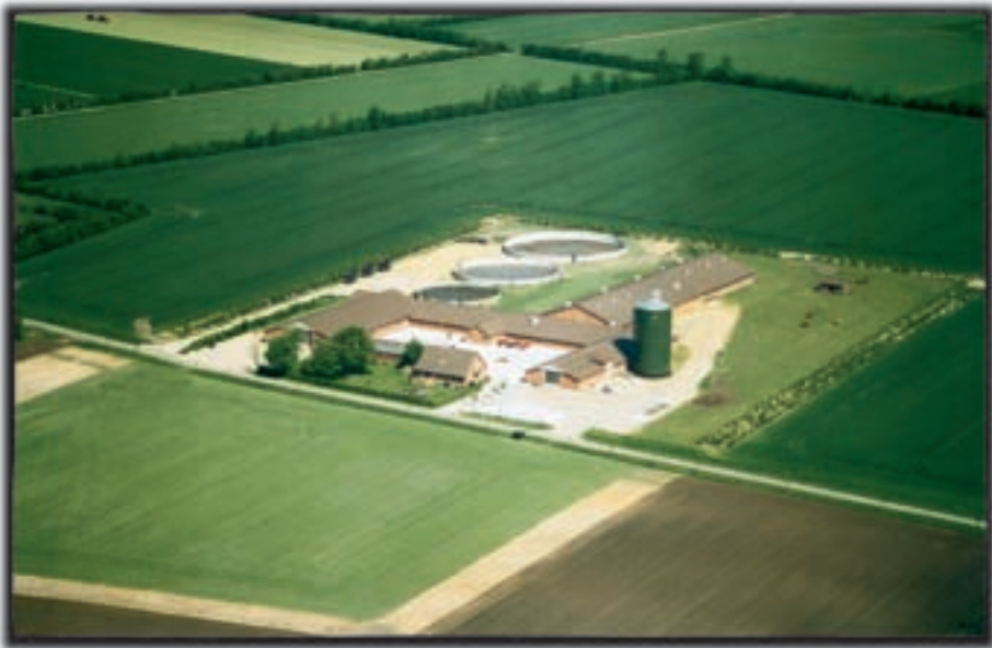
Figur 2-4. Et rationelt brug fra årtusindskiftet med lagerplads til foder og gylle. Selvom bygningerne er blevet store, er det højst sandsynligt, at der kun er enten køer eller svin. Bemærk i øvrigt de store marker.

I 1880'erne kom den næste store omstilling derfor, idet vi gik fra at producere korn til at udnytte kornet som råstof i den animalske produktion. Samtidig kom andelsbevægelsen med nye mejerier og slagterier. I perioden 1883-1914 blev der bygget ca. 1000 andelsmejerier her i landet. Vores hovedeksportmarked var stadig England, men vi eksporterede nu smør, bacon og æg. Denne omstilling var en bragende succes; beskæftigelsen i