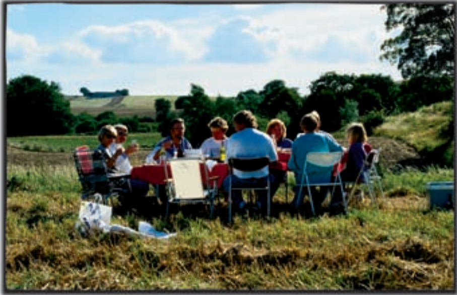
Figur 2-7. Mere fritid betyder bl.a. en større rekreativ udnyttelse af det åbne land

modificerede produkter, der indeholder alle nødvendige vitaminer og mineraler, og som er garanteret fri for “naturlige” sygdomsfremkaldende bakterier.