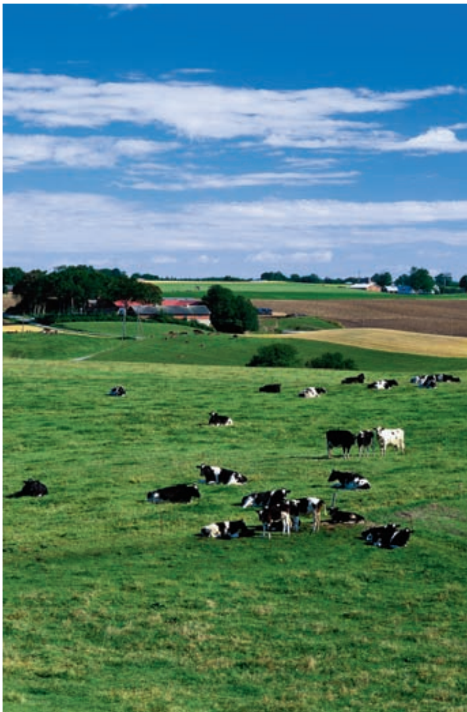
Figur 2-1. Det multifunktionelle jordbrug skal tilgodes mange funktioner.