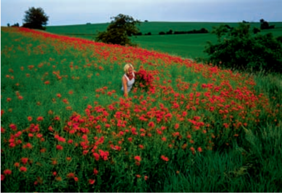
Figur 2-2. En mark med smukke markblomster eller en lidet produktiv, ukrudtsbefængt mark?

taler om aftagende grænsenytt, dvs. at jo mere man har af en ting i forvejen, jo mindre pris sætter man på at få en enhed mere.