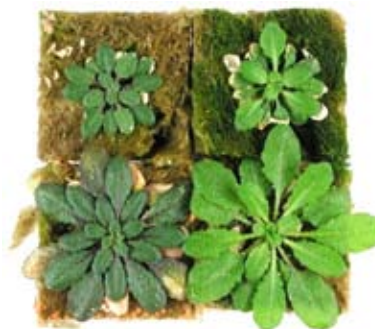
Figur 1. Planter der mangler fosfat, skifter farve over mørkegrøn til violet. Her ses forsøgsplanten gåse-mad ( Arabidopsis thaliana ), dyrket ved forskellige niveauer af fosfat. Ekstremt lavt (0.01 mM P, øverst til venstre), lavt (0.05 mM P, nederst til

Ved fosfatmangel visner de ældre blade, og deres fosfat og andre næringsstoffer transporteres til yngre blade og genbruges. Fosfat kan nemt transporteres rundt i de vegetative