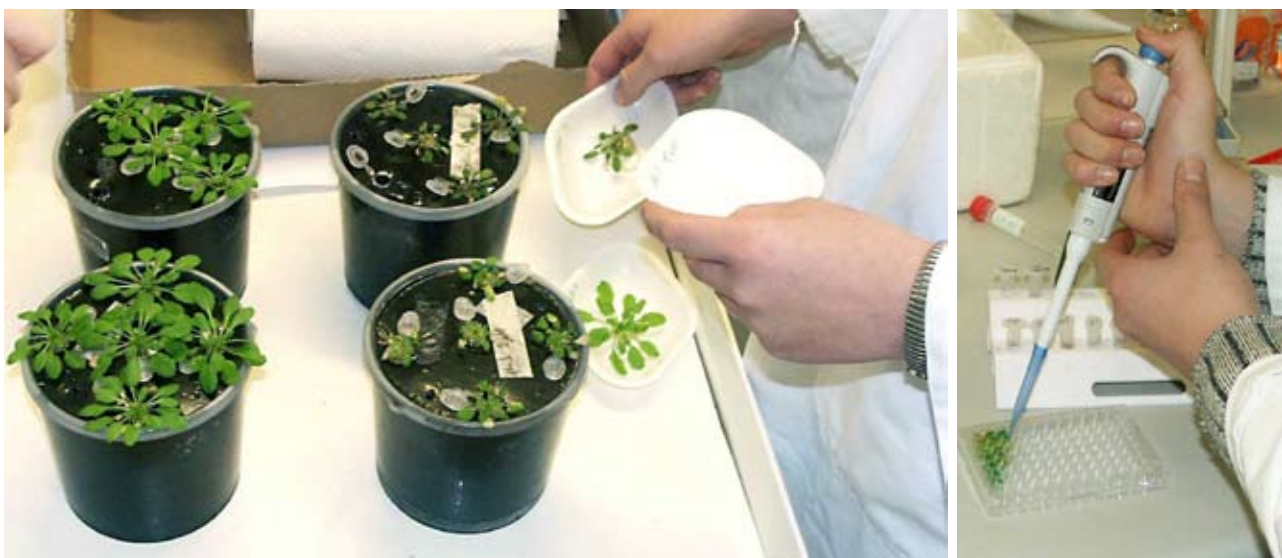
Figur 3. Forsøgsplanten gåsemad ( Arabidopsis ) dyrkes i spande med næringsopløsning, således at både blade og rødder kan høstes og analyseres. Fosfat ekstraheres fra plantevævet og med et farvereagens synliggøres fosfatkoncentrationen (der dannes et grønt farvekompleks), og derefter måles farveintensiteten (absorbansen) af opløsningen.

En del fosfat-responsive gener koder for enzymer, der er med til at øge optagelsen af fosfat fra jordbunden eller til at remobilisere fosfat fra andre plantedele. Nogle af disse enzymer frigør fosfat fra organiske forbindelser, så fosfatet