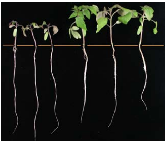
Figur 2. Planter der mangler fosfat er mindre, men de kan alligevel have en større rodlængde end planter, som er forsynet med tilstrækkelig fosfat. Dette ses her for tomatplanter, som er dyrket med hhv. lav (til venstre) og høj fosfatforsyning (til højre).

kan planterne mangle fosfat, selvom jordens fosforindhold er højt.