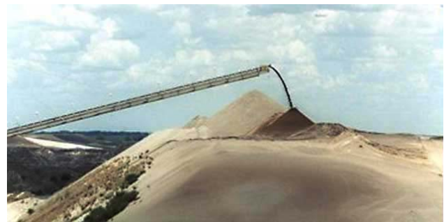
Figur 1. Råfosfat knuses før udvinding.

Hos planten fungerer fytinsyre først og fremmest som en lagerforbindelse, der først tages i brug i forbindelse med spiring af det modne frø. Under frøets spiring forsynes den fremvoksende plante med fosfat, frigjort fra fytin-