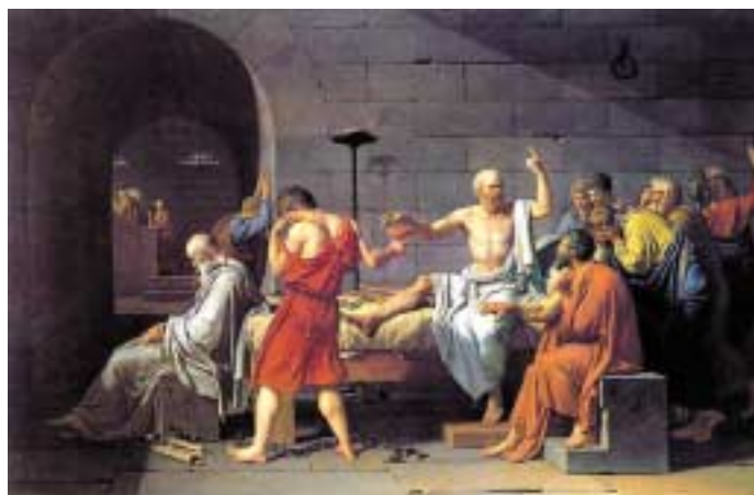
Figur 1. The death of Socrates (JL David, 1787, Metropolitan Museum of Art).

»Det skal ske«, sagde Kriton. »Men er der også andet, du vil sige?« Således adspurgt svarede han ikke mere, men lidt efter rørte han på sig; og da manden dækkede ham af, var hans øjne stivnede. [2].