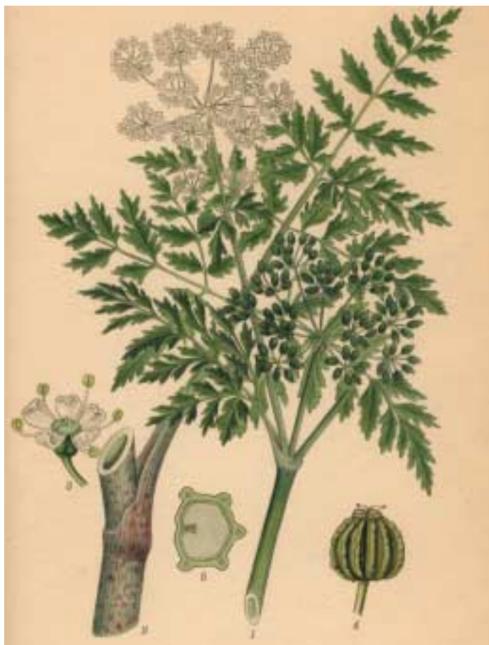
Figur 2. Skarntyde ( Conium maculatum ) hører til skærmblostmfamilien (Apiaceae) ligesom f.eks. gulerod, røllike og bjørneklo. Planten kan blive over 1 m høj og blomstrer med hvide blomster i juni-juli. Stængelen er glat med et blåt skær og rødpletet forneden (deraf navnet maculatum = plettet). Bladene er 3-4 dobbelt fjersnitdelte. Skarntyde er 2-årig og danner første år en roset af blade. Året efter vokser det blomsterbærende skud frem. Planten findes hist og her i Danmark og ynder fugtig og næringsrig jord, der jævnligt forstyrres, f.eks. ved beboelser, i grøftkanter og på strandvolde. Linné gav planten slægtsnavnet, Conium, efter »coneion« (gift-drik af skarntydesaft som de gamle athenensere brugte til at eksekvere dødsdomme med). 1. Del af en blomstrende stængel. 2. Et stykke af stængelens nedre del med et blåt skær. 3. Blomst (8:1). 4. Frugt (5:1). 5. Delfrugt i tværsnit (10:1). (Tegning af Axel Ekblom fra 13,4).

den er blevet indført af munke sydfra, hvor den er langt hyppigere [4].